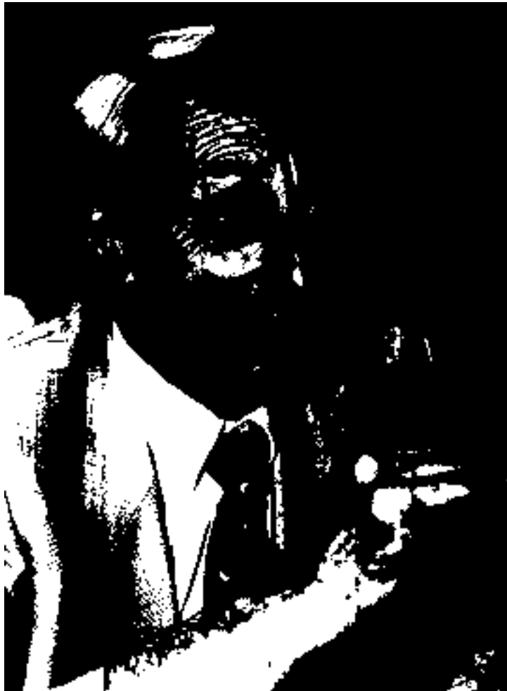
Die Bürgerinnen und Bürger befragen die Auskunftspersonen

Wir wünschen eine faire und solidarische Preispolitik der Industrie gegenüber den Ländern der Dritten Welt. Die Nutzung der genetischen Ressourcen der Dritten Welt durch die Industrie soll den Ursprungsländern finanziell abgegolten werden.