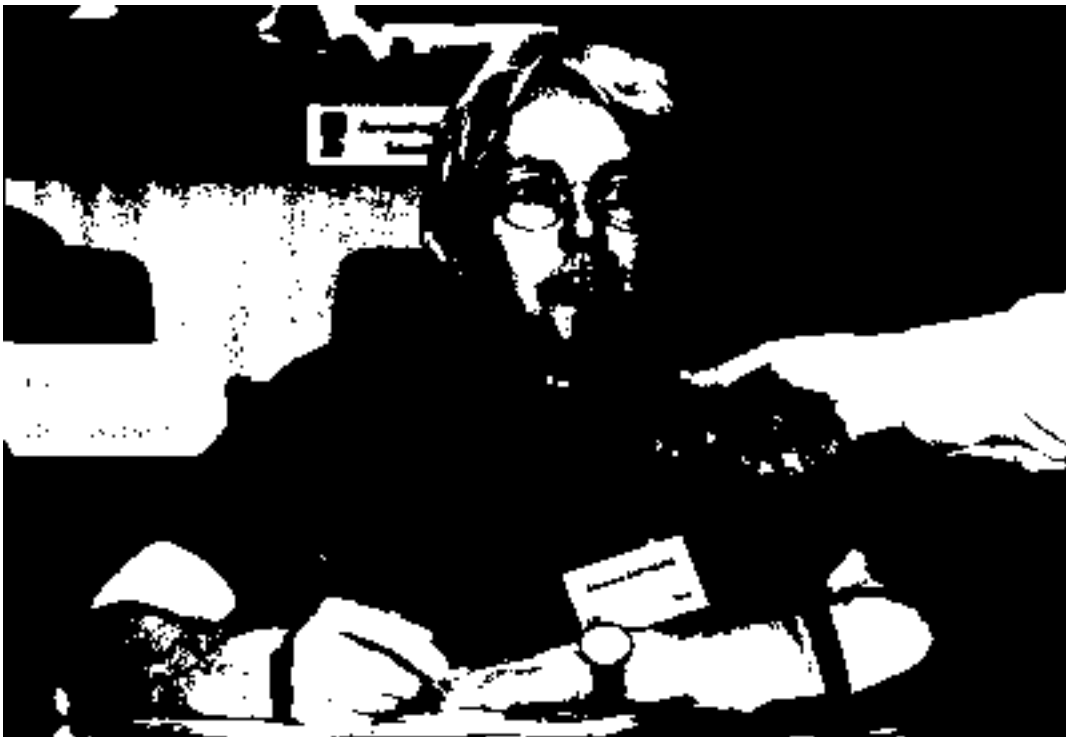
Die Bürgerinnen und Bürger befragen die Auskunftspersonen

Das Panel sieht ein, dass ein totales Verbot für die Forschung in der Schweiz negative Auswirkungen hätte. Indem wir ein Monitoring befürworten, sind wir auf ausgebildetes Personal und auf die Möglichkeit angewiesen, Forschung über GVO zu betreiben.