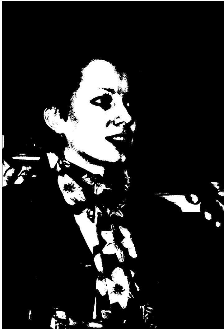
Die Bürgerinnen und Bürger befragen die Auskunftspersonen