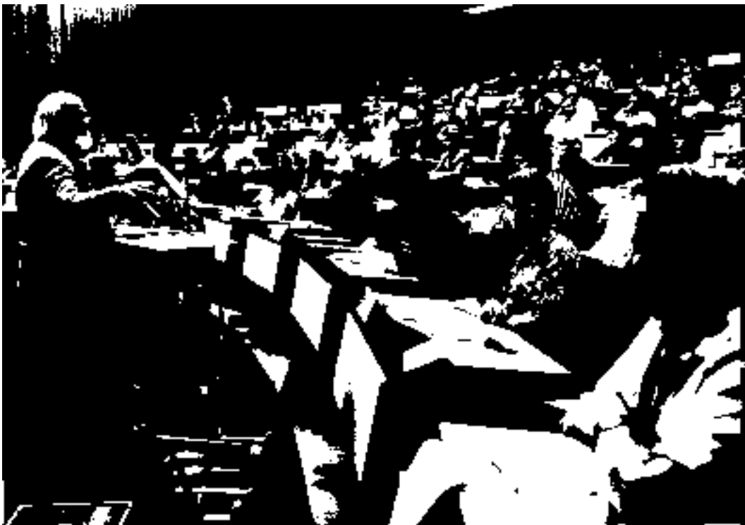
Anhörung der Auskunftspersonen

Der heutige Stand der wissenschaftlichen Kenntnisse erlaubt es uns nicht auszuschliessen, dass spezifische, aus gentechnisch veränderten Organismen entstandene Risiken existieren. Da man diese Risiken nicht quantifizieren kann, sind wir nicht in der Lage, deren Tragbarkeit zu beurteilen. Als eine Folge der oben erwähnten Gründe empfiehlt eine Mehrheit des Panels ein Moratorium über die Herstellung und Vermarktung von gentechnisch veränderten Organismen. Abgegrenzte Feldversuche (namentlich durch öffentliche Institutionen) sollen zugelassen und kontrolliert werden, um vertiefte Erkenntnisse über allfällige Risiken zu gewinnen.